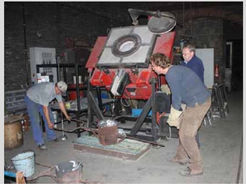
Schmelzofen und Transport der Gussmasse